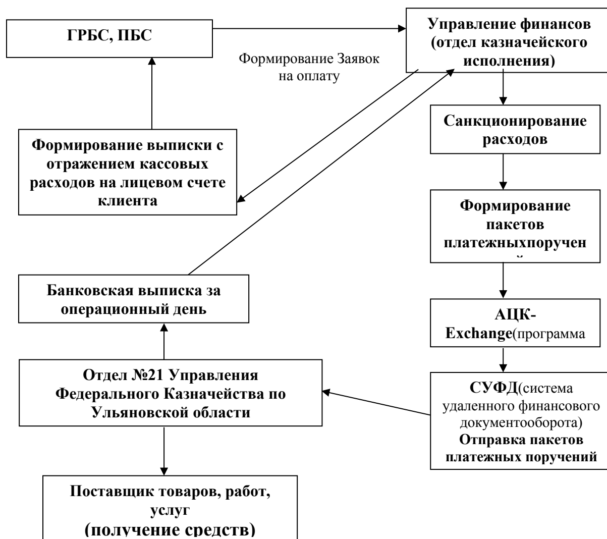
Схема 1. Финансирование Муниципальных Казенных учреждений