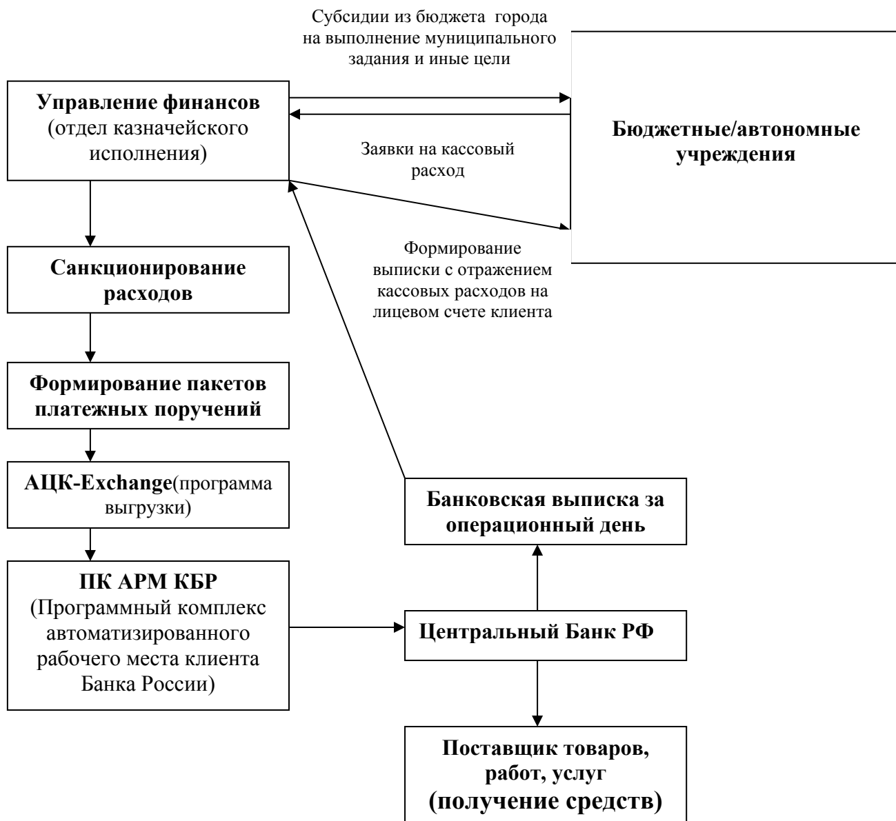
Схема 2. Финансирование бюджетных/автономных учреждений

После завершения процедуры санкционирования Заявок на кассовый расход бюджетных/автономных учреждений работниками отдела казначейского исполнения готовятся платежные поручения на исполнение заявок клиента в электронном виде, которые заверяются электронно-цифровыми подписями и формируются пакеты.