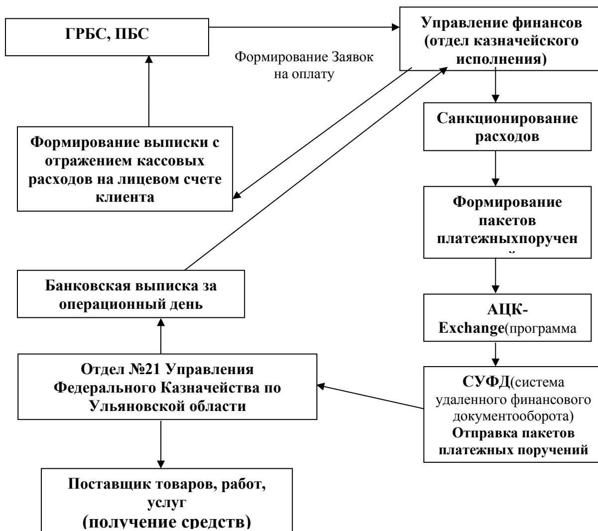
Схема 1. Финансирование Муниципальных Казенных учреждений